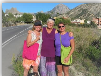
Med vänner på promenad...